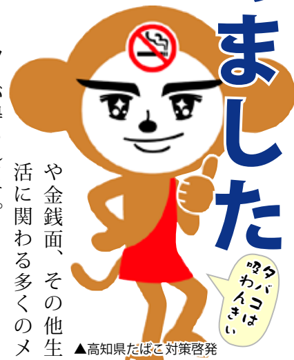
▲高知県たばこ対策啓発キャラクター スワンキー