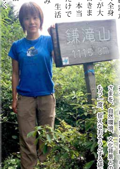
趣味は自転車や山歩きなどのアウト ドア。こちらは早明浦ダム北面 に位置する鎌滝山山頂での一枚。