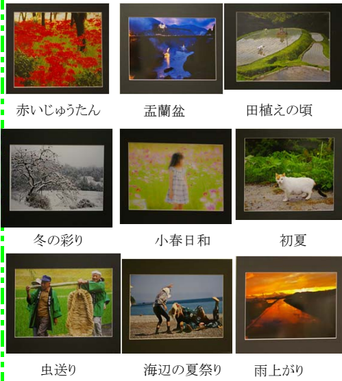
赤いじゅうたん 孟蘭盆 田植えの頃 冬の彩り 小春日和 初夏 虫送り 海辺の夏祭り 雨上がり