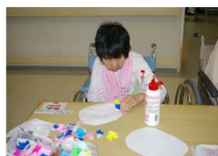
作業レクで紫陽花の花を作りました