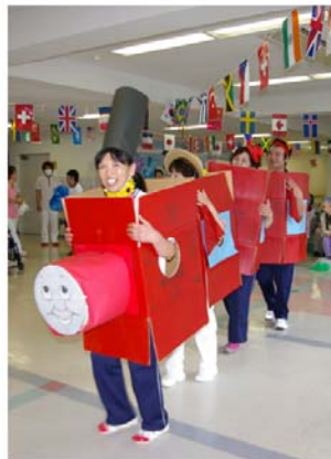
応援合戦「赤組列車」