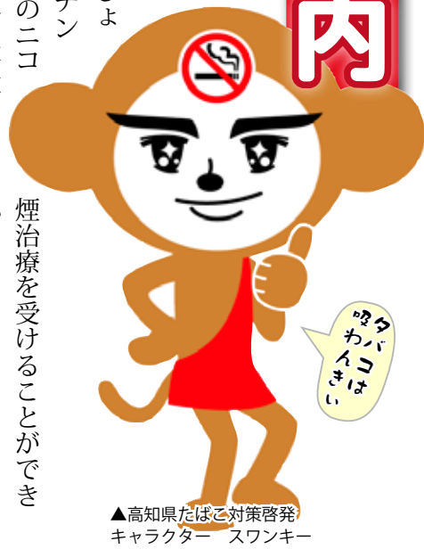
▲高知県たばこ対策啓発キャラクター スワンキー

禁煙治療を健康保険等で受けるには一定の要件があり、1回目の治療で医師が確認し、要件を満たさない場合でも、自由診療で禁